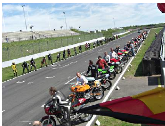
Echt sehenswert – das 4 Stunden Classic Endurance mit edlen Bikes und guter Action am Sonntag ab Zwei