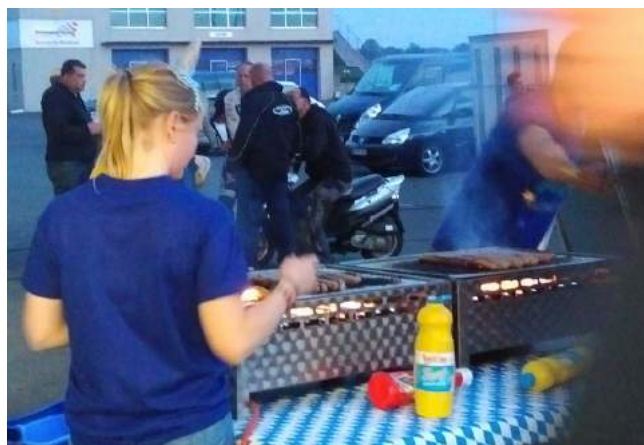
Zum Feierabend werfen wir den Grill an – nach so einem harten Tag braucht's eine Stärkung. Ein Fässchen gibt's dazu...