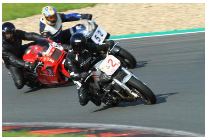
Classic Perfection - hier ist das Paradies für alte Schätzchen Donnerstag und/oder Freitag mit je 4 Turns zum Sonderpreis