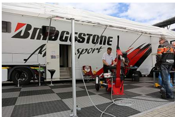
Der Bridgestone Racing Service ist mit einem Truck voller Grip und jeder Menge Testsieger-Reifen dabei.