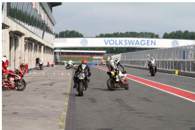
Der offizielle Saisonauftakt in Oschersleben mit 4 Tagen Training für Einsteiger, Fortgeschrittene und Knieschleifer