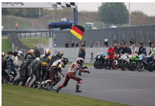
Endurance 4 Fun – Auftakt der Bridgestone 100 für Amateure in 3 Klassen mit klarem Reglement am Donnerstagnachmittag